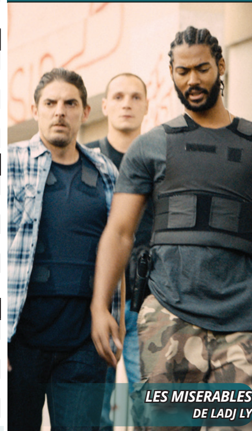
LES MISÉRABLES DE LADJ LY

ESPLANADE FRANÇOIS MITTERRAND - 83220 - LE PRADET