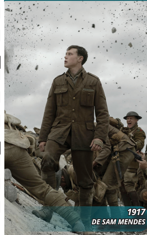
1917 DE SAM MENDES

ESPLANADE FRANÇOIS MITTERRAND - 83220 - LE PRADET