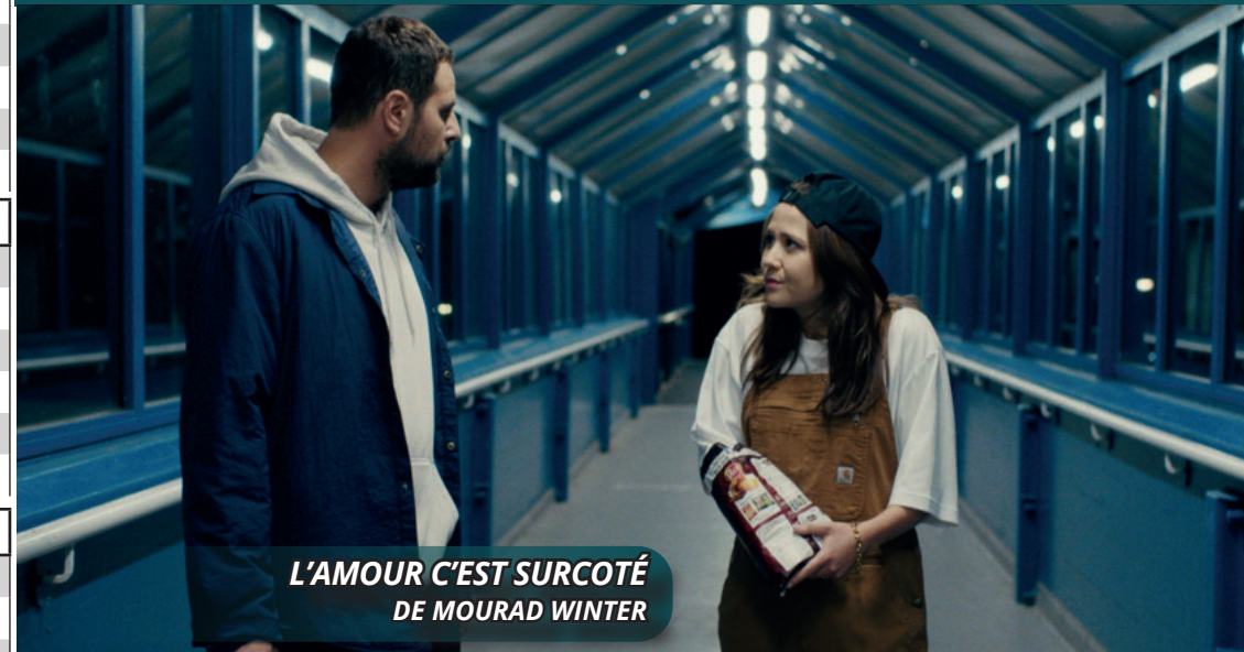
L'AMOUR C'EST SURCOTÉ DE MOURAD WINTER

ESPLANADE FRANÇOIS MITTERRAND - 83220 - LE PRADET