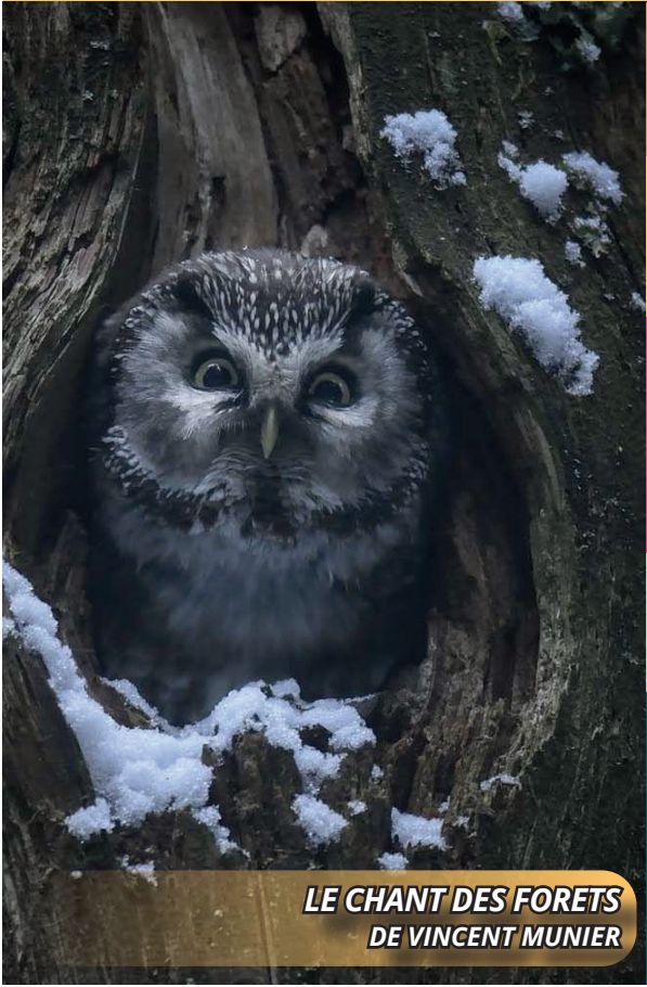
LE CHANT DES FORETS DE VINCENT MUNIER

LA SÉANCE SPÉCIALE : GENRE CONSCRÉE AUX FILMS FANTASTIQUE, HORREUR ET AUTRES CURIOSITÉS L'ECHELLE DE JACOB (VOST) JEUDI 8 JANVIER - 20h30 LA SÉANCE SPÉCIALE : DÉCOUVERTE CONSCRÉE AUX NOUVEAUX TALENTS DU CINÉMA MONDIAL REBUILDING (VOST) JEUDI 22 JANVIER - 20h30 CINÉ - DÉBAT Samedi 24 Janvier - 20h30 ELLE ENTEND PAS LA MOTO Film projeté en version française sous titrée pour les personnes sourdes et malentendantes Séance suivie d'un debat avec l'association C.L.L.S.F 83