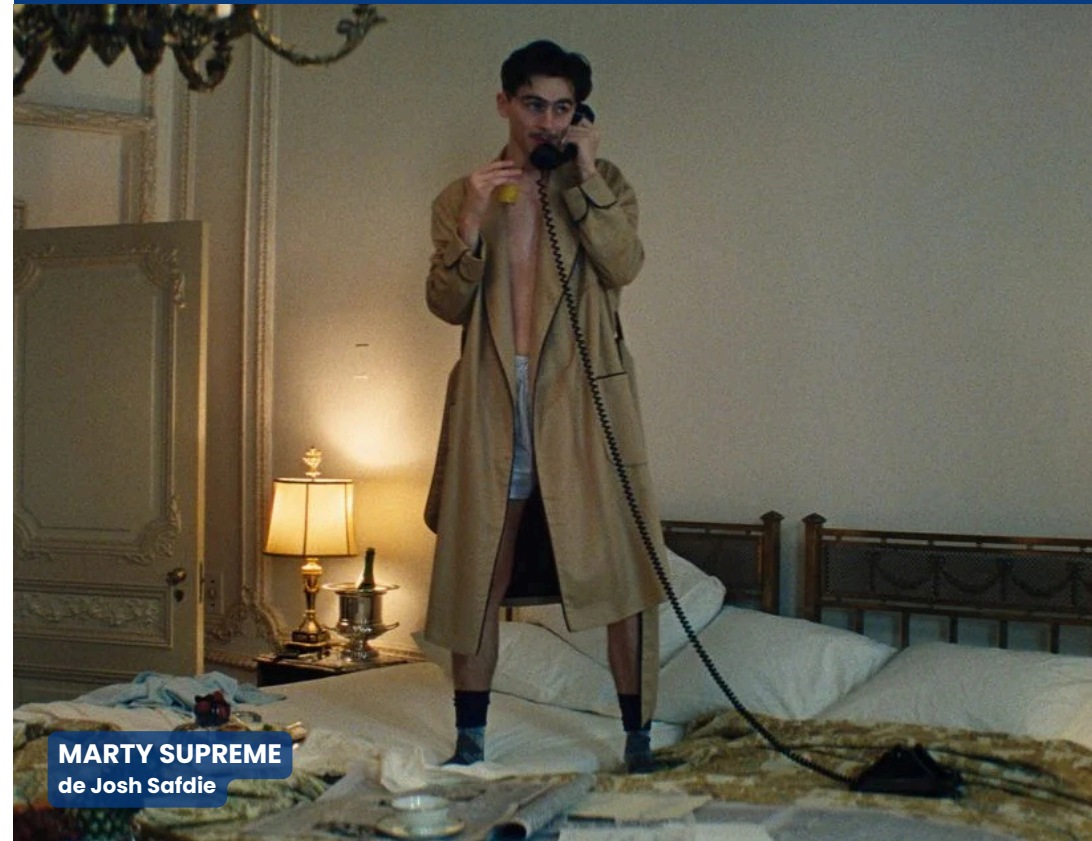
MARTY SUPREME de Josh Safdie

SQUARE MARC-BARON • 83430 SAINT-MANDRIER-SUR-MER